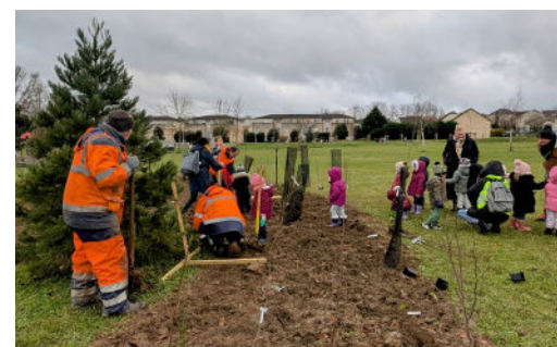
Plantation de la micro-forêt au Jardin des Poètes - décembre 2024

415 élèves des six écoles ont participé, en décembre, à une plantation d'arbres au Jardin des Poètes. Les enfants ont planté différents types d'arbres pour créer une micro-forêt de 450 m 2 . Chaque élève pourra voir son nom associé à l'arbre qu'il a planté et le suivre au fil des années. L'objectif est de sensibiliser à la biodiversité et aux bienfaits des arbres, qui créent des microclimats, nourrissent les animaux, stockent le carbone et contribuent à la viabilité biologique.