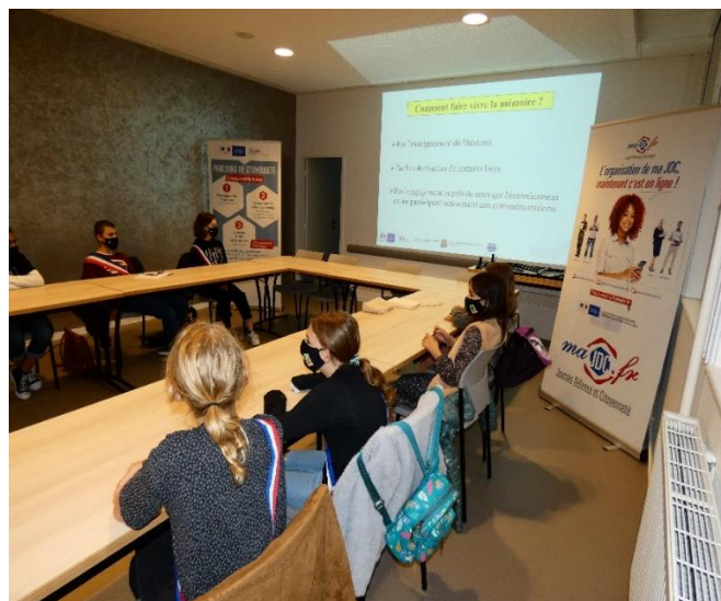
Introduction au jeu « explique-moi une cérémonie » : « Comment faire vivre la mémoire ? »

Participant aux cérémonies commémoratives de leur commune, les enfants se sont montrés très réceptifs au jeu « explique-moi une cérémonie ». Mis en place par l'Office national des anciens combattants et victimes de guerre (ONACVG), ce dernier permet de rappeler les valeurs de notre République et l'importance de notre mémoire nationale.