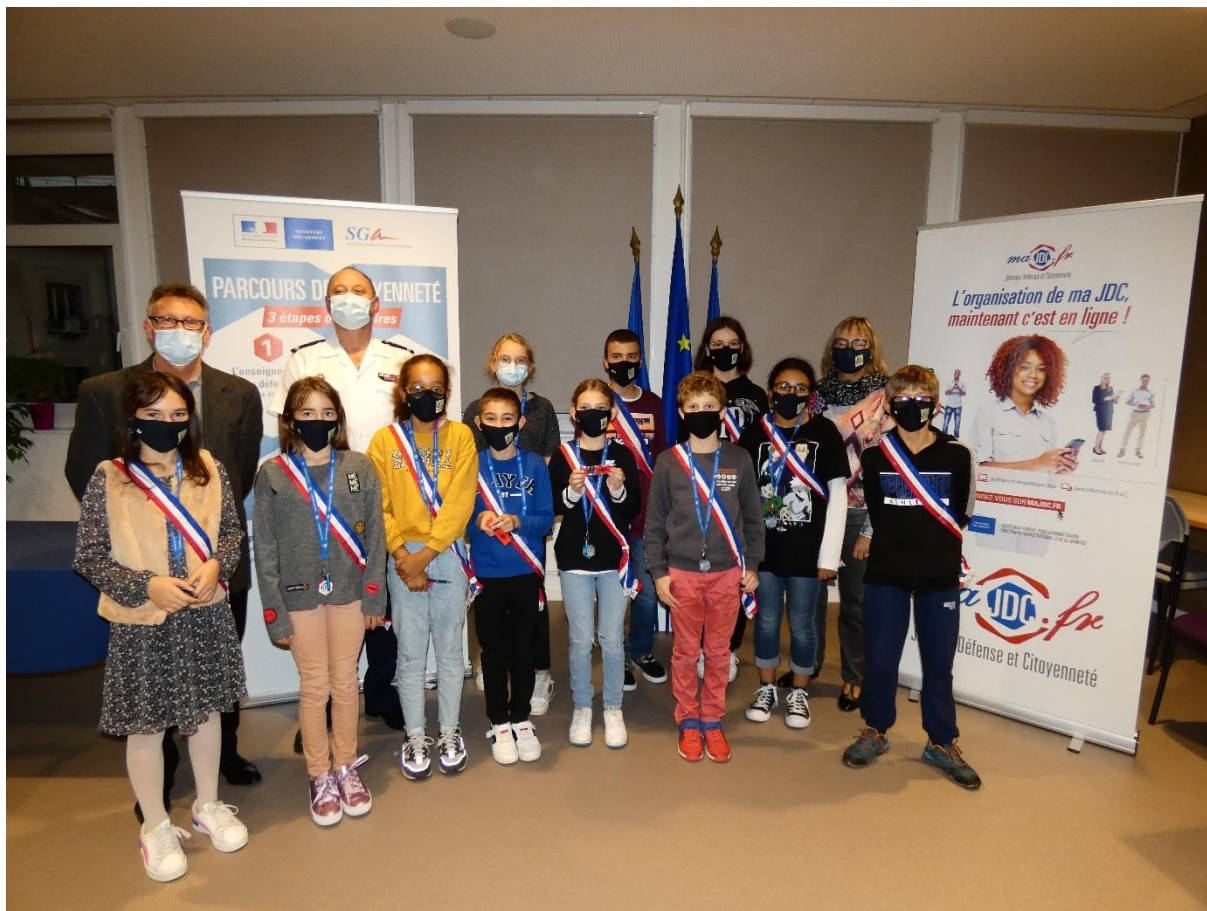
Un moment éducatif très agréable et ludique, en compagnie de M. le maire junior et du conseil municipal des enfants de Dombasle-sur-Meurthe