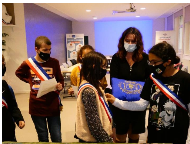
Remise de décorations

Monsieur le Maire Junior préfère, pour jouer, endosser le rôle de Préfet cette fois ! dit-il.