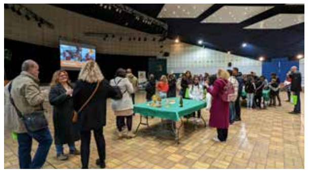
Réception d'accueil des nouveaux habitants - Novembre