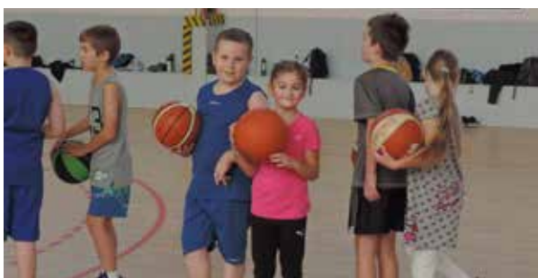
Stage enfants organisé par le Dombasle Basket pendant les vacances de la Toussaint - Octobre