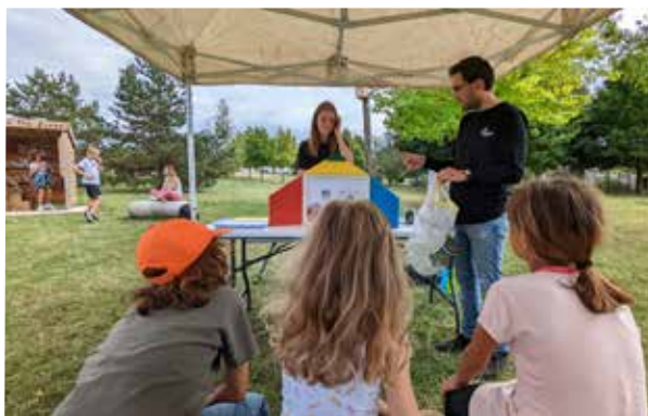
2 e édition de la Semaine Verte - Septembre