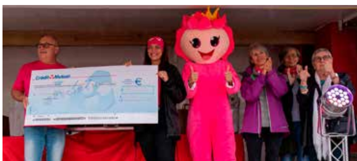
2 e édition de Dombas'Rose - 800 participants - 7 454 € reversés à l'Association Symphonie - Octobre