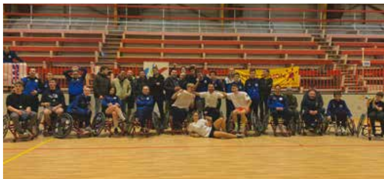
Tournoi handisport en faveur du Téléthon organisé par le Handball Dombasle - Décembre