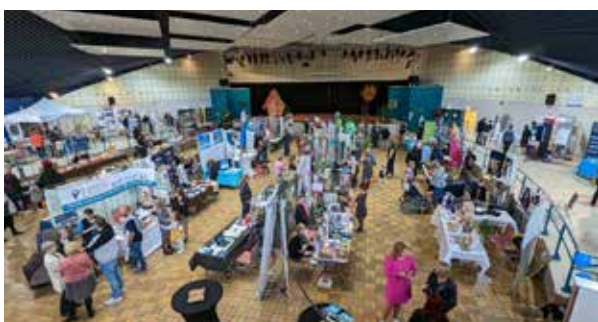
2 e Foire Commerciale proposée par l'association des commerçants Dac&Co - Octobre