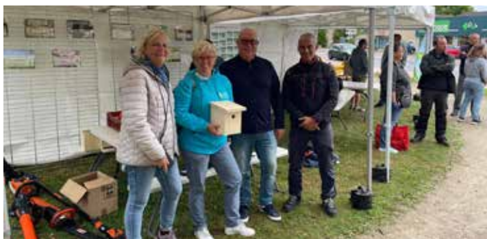
2 e édition de la Semaine Verte - Septembre