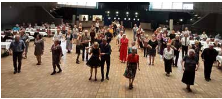
Thé dansant - Octobre