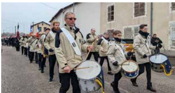
L'Harmonie Jeanne d'Arc présente lors de la Cérémonie patriotique du 11 Novembre - Novembre