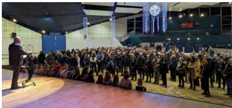
Vœux du Maire à la population - Janvier