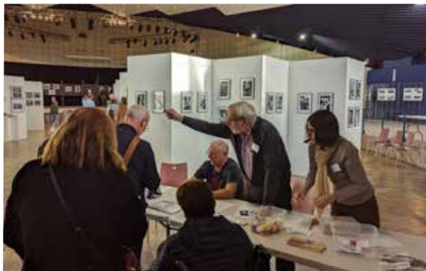
6 e rencontres photographiques Club Photo Vidéo Dombaslois - Octobre