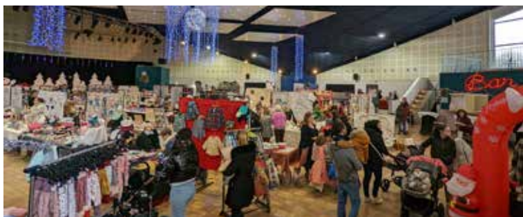
Marché de Noël - 75 exposants - 2 000 visiteurs - Décembre