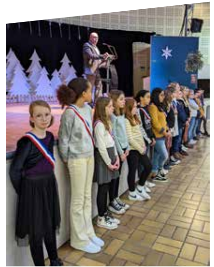
Couverture : Cérémonie des Vœux du Maire à la population - Janvier