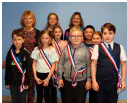
Réunion d'intégration de sept nouveaux membres - Octobre