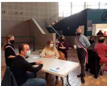
Distribution des collations lors de la collecte du don du sang - Octobre