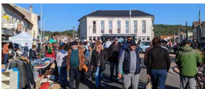
34 e édition du Salon d'automne - Environ 10 000 visiteurs - Octobre