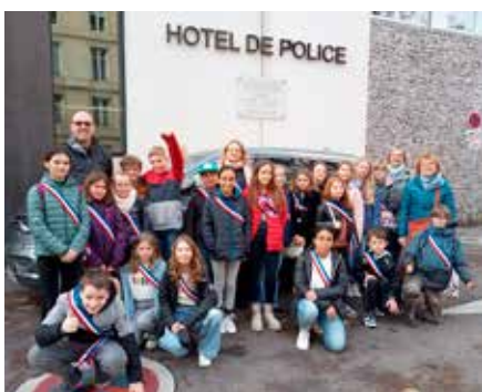
Visite de l'hôtel de police de Nancy - Novembre