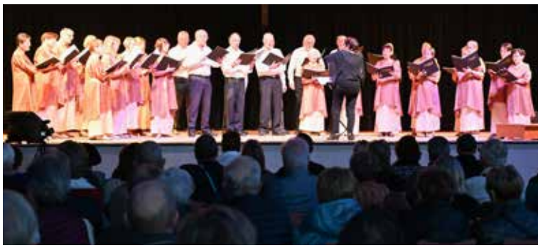
8 e Festival notes d'automne par Chorus 2000 - Novembre