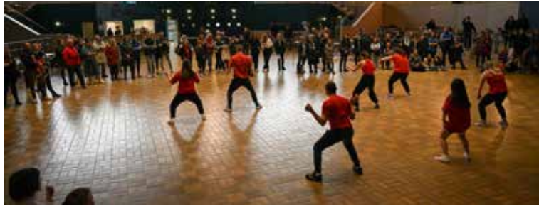
Scène en'Basle organisé par la MJC Jean Monnet - Novembre