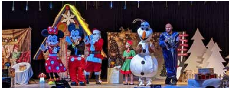
Spectacle de la Saint-Nicolas - 2 représentations - 400 spectateurs - Décembre