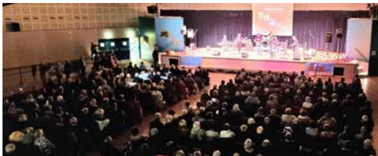
Concert solidaire en présence de The starsmen, Chorus 2000 et 50'cats en faveur de l'association Nina, un Rayon de Soleil - Novembre