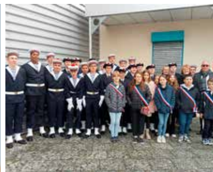
Participation du CME à la cérémonie patriotique du 11 Novembre en présence de la Préparation Militaire Marine de Nancy