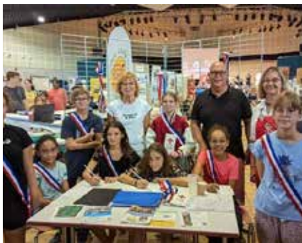
Participation du Conseil Municipal des Enfants (CME) au Forum des associations - Septembre