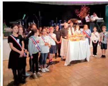
Présence des jeunes élus au Repas des seniors afin d'aider au service à table - Septembre