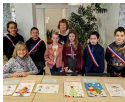
Jury du concours de dessins de Noël - Décembre