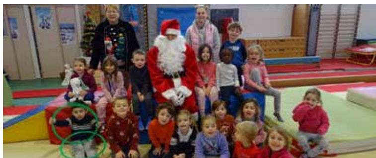
Visite du Père Noël au Club de Gymnastique, section loisirs - Décembre