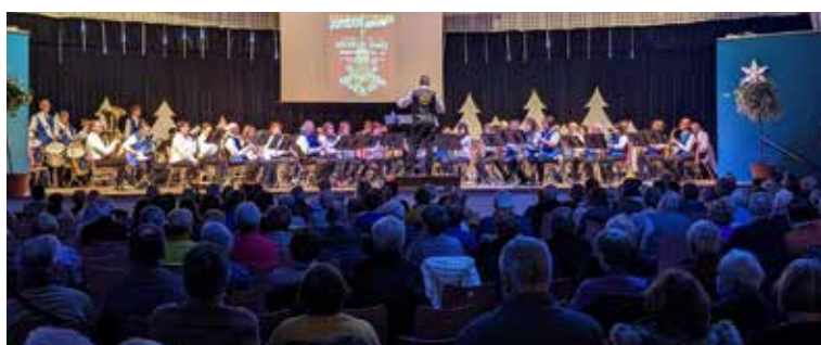
Concert de la nouvelle année en présence de l'Harmonie Jeanne D'arc - Janvier