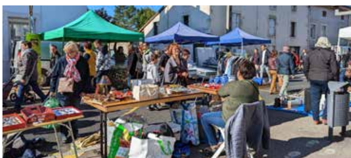
34 e édition du Salon d'automne - 800 emplacements - Octobre