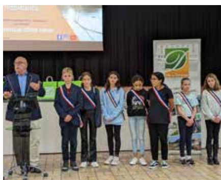
Présence à la cérémonie d'Accueil des nouveaux habitants - Novembre