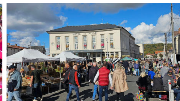
Octobre - Salon d'automne