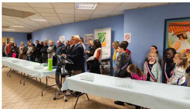
Soirée des nouveaux arrivants

La rencontre a démarré par la projection d'un film court, réalisé par Pierre Streiff, responsable communication à la Mairie de Dombasle. Il présentait les événements récents et de belles vues aériennes de la ville.