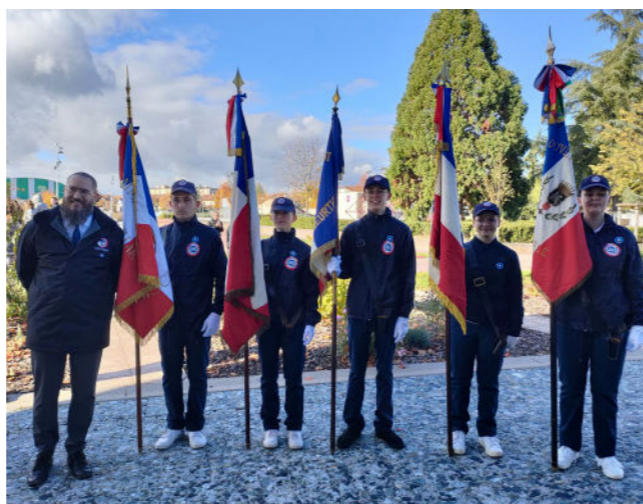
Adolescent(e)s ayant adhéré(e)s au programme SNU

Les personnes souhaitant être formées aux gestes d'urgences participeront à une sensibilisation d'1h30 et suivront la formation de 3h30 animée par un formateur agréé de l'association. Renseignements et inscriptions à citoyennete.defense@gmail.com .