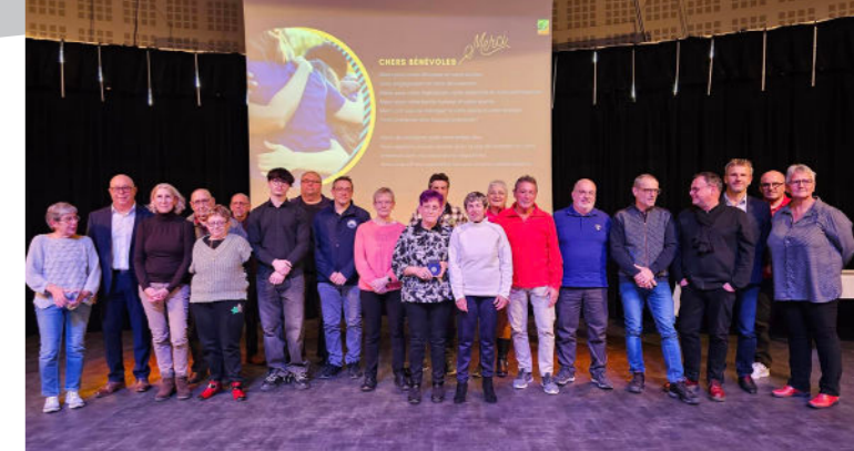
Bénévoles de la commune de Dombasle-sur-Meurthe

Pour cette cérémonie de mise à l'honneur des bénévoles, la Municipalité a souhaité récompenser :