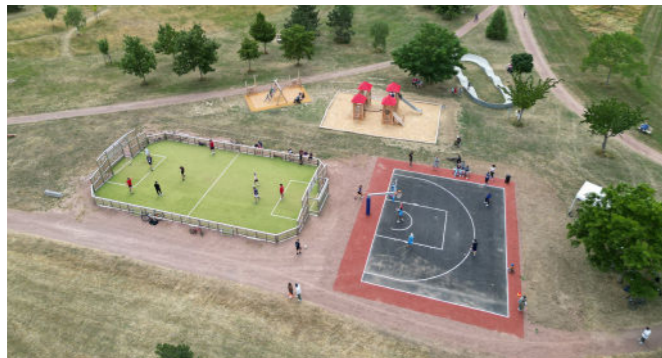
Réaménagement et valorisation - Espace du Jardin des Poètes