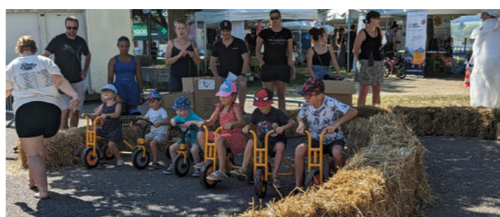
Octobre - 3 e édition de Dombasl'Rose - Plus de 1 100 marcheurs et coureurs