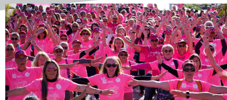
Octobre - 3 e édition de Dombasl'Rose