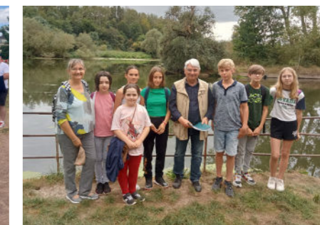
Visite commentée du site de l'ancienne piscine - 13 septembre