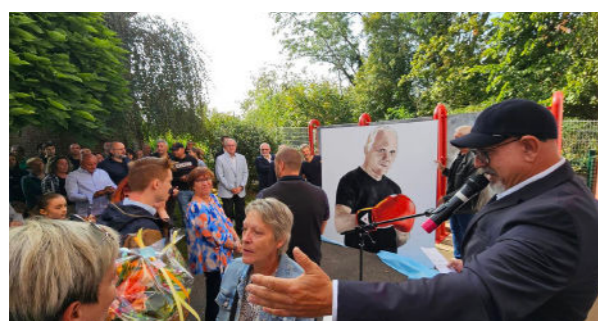
Septembre - Inauguration du Complexe Sportif René Cordier