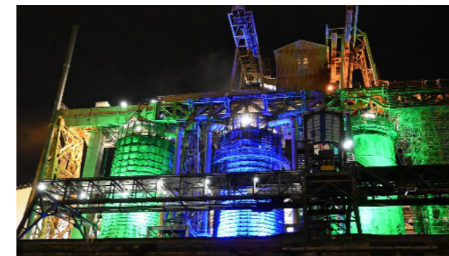
Illuminations des Fours à chaux pour le 150ème anniversaire de Solvay Dombasle

Les travaux de rénovation de l'estacade, cette grande structure métallique qui supporte les fours à chaux, arrivent à leurs termes. Ils seront succédés par l'installation d'un quatrième four à chaux qui servira dès 2027 lors des arrêts des autres fours pour maintenance planifiée.