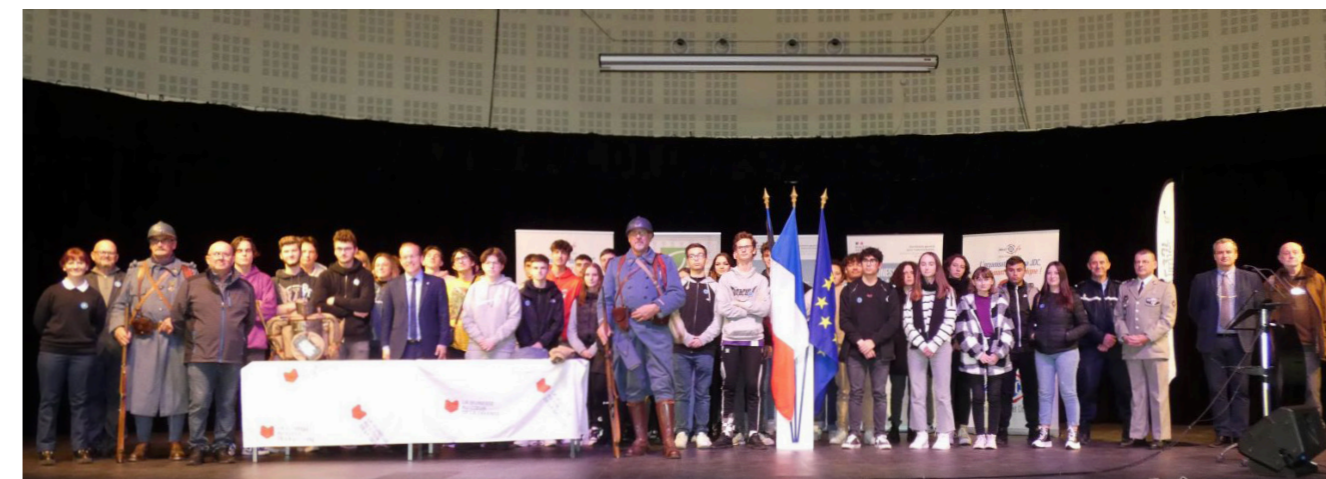
48 jeunes présents pour la Journée Défense et Citoyenneté

Un dépôt de gerbe a eu lieu au Monument aux Morts, sur la place de la République. À l'issue de cette journée, les autorités civiles et militaires ont procédé à la cérémonie de remise des certificats individuels de participation.