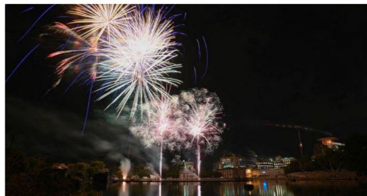
Juillet - Spectacle pyrotechnique - Fête nationale