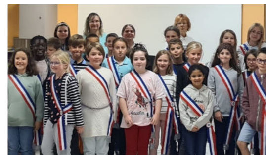
Intégration de 22 nouveaux membres - 18 octobre