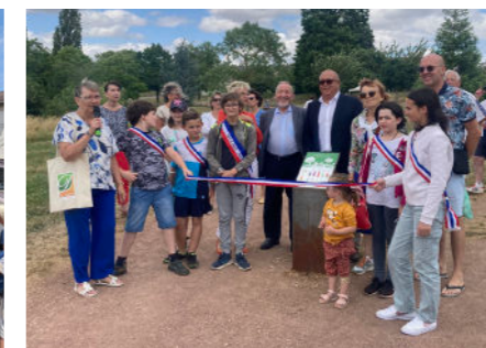
Inauguration des espaces sans tabac et signature de la convention - 5 juillet