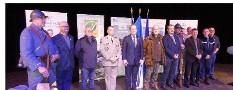
Novembre - Journée défense citoyenneté