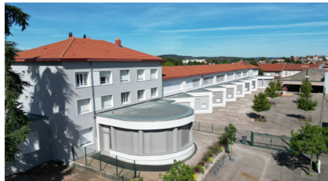
Rénovation de l'école - Maurice Carême