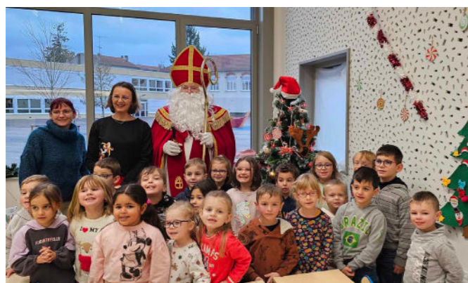
Saint-Nicolas et des élèves de la commune

L'évêque de Myre fut accueilli par des chants de bienvenue et, pour remercier les enfants sages, a procédé à une distribution de clémentines.