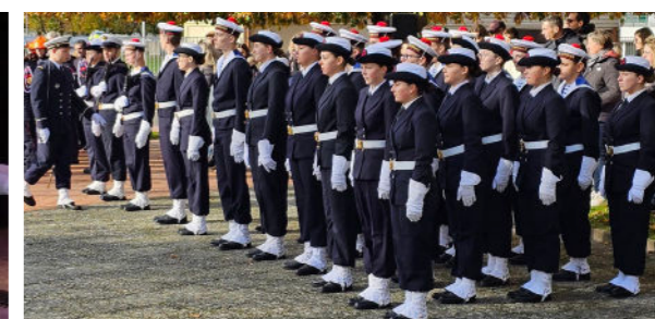
Novembre - Cérémonie du 11 novembre