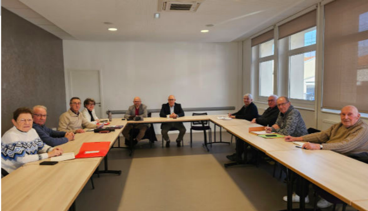
Membres du Conseil des Sages

Conception d'un ouvrage commun sur la vie dombasloise d'antan : Les Cités du Maroc, Les Patronages, Les cafés, les cinémas... le château, La vie durant la 2 e guerre mondiale.