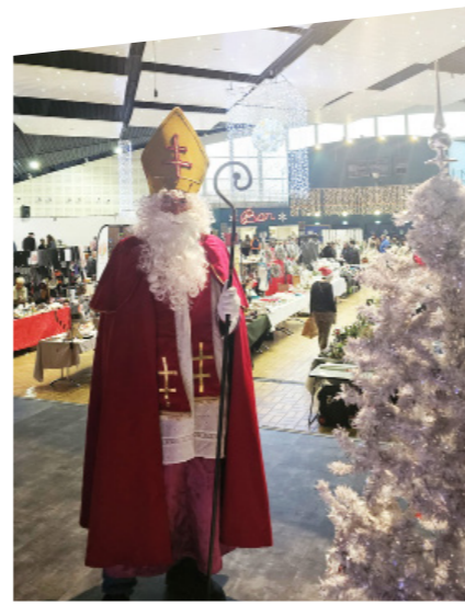
Couverture : Marché de la Saint-Nicolas - Décembre 2023