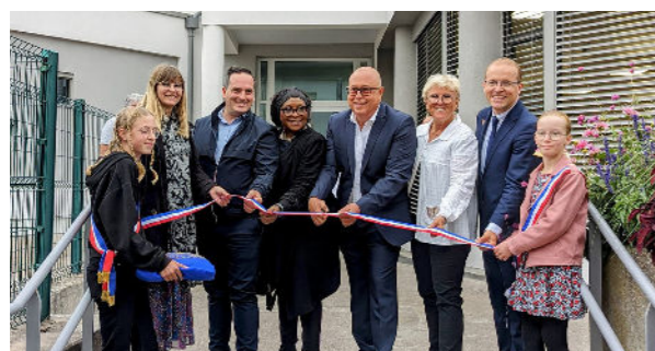
Août - Inauguration de la rénovation de l'école Maurice Carème