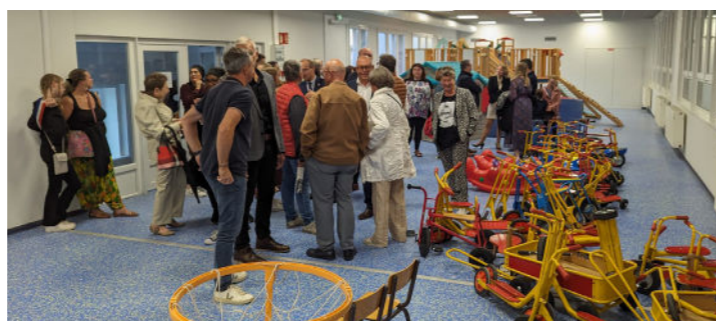
Juillet - Spectacle pyrotechnique - Fête nationale