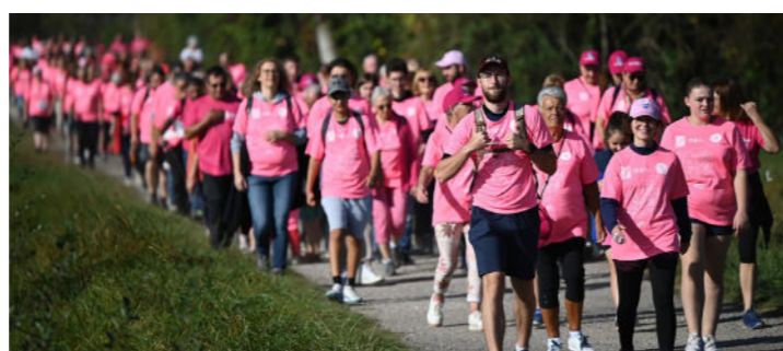
Octobre - 3 e édition de Dombasl'Rose - Plus de 1 100 marcheurs et coureurs