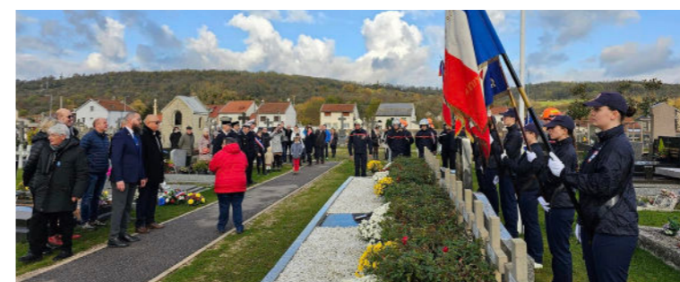
Novembre - Cérémonie du 11 novembre