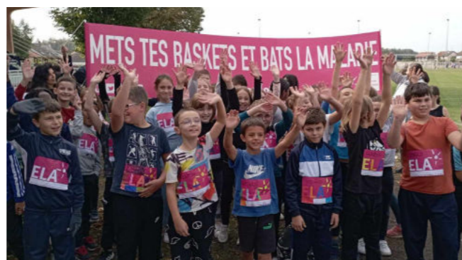
Élèves de la commune participants à « Mets tes baskets »

Certains groupes scolaires ont battu le record de dons et ont dépassé les 2000€. Les élèves ont mis leurs capacités sportives au profit de la solidarité avec encore plus de participants cette année.