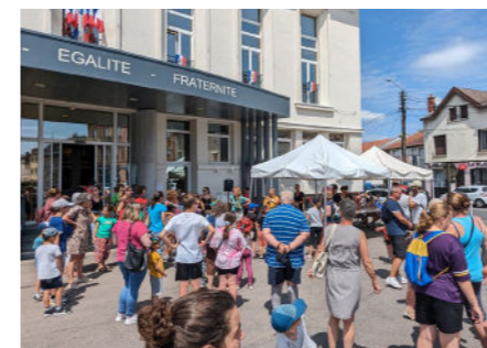
Jeu de piste - 28 juin