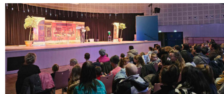
Décembre - Spectacle de la Saint-Nicolas