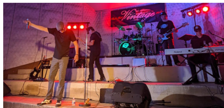
Juin - Fête de la Musique