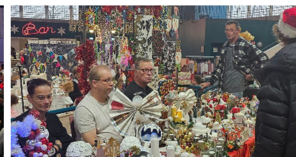
Décembre - Marché de la Saint-Nicolas