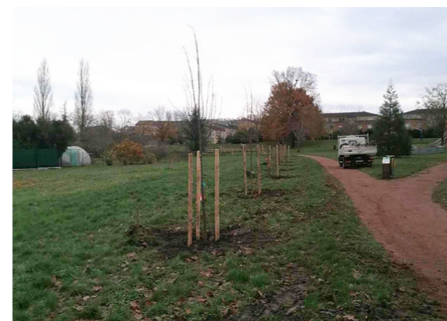
82 tilleuls - Espace intergénérationnel au Jardin des Poètes

Les agents du Pôle environnement et cadre de vie se sont mis à l'œuvre pour réaliser la plantation de 82 tilleuls à proximité des zones de passages de l'Espace intergénérationnel du Jardin des Poètes.