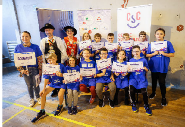
Participants de Dombasle-sur-Meurthe à l'École des Champions 2023

Le succès de la première édition de l'École des champions et l'implication de tous : élèves, enseignants, associations dombasloises etc. nous permettent de vous annoncer que cette action sera reconduite le 12 avril 2024 prochain.