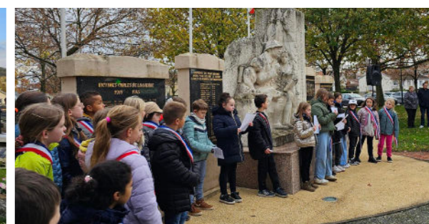
Novembre - Cérémonie scolaire du 11 novembre