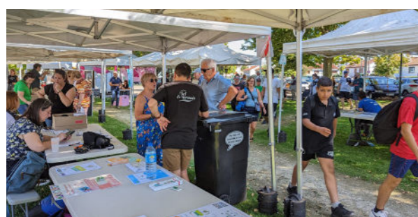
Septembre - 3 e édition de Dombasl'Vert