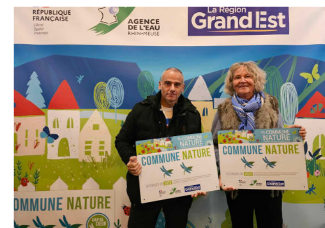
Ville de Dombasle, labellisée « Ville Nature 2 Libellules »

Pour obtenir ce label, la commune doit être engagée dans un plan de gestion différenciée et réaliser des opérations à travers cette nouvelle gestion (végétalisation du cimetière, plantation d'arbres, îlots de fraîcheur, transformer les massifs d'annuelles en vivaces, stopper le fleurissement hors sol etc.).