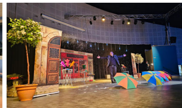
Décembre - Spectacle de la Saint-Nicolas