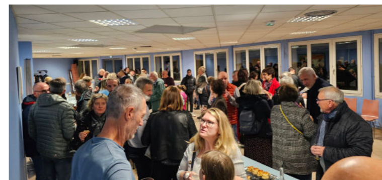
Novembre - Accueil nouveaux habitants - Remise des cartes électorales