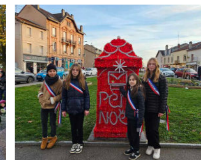
Concours de dessins au Père Noël Jusqu'au 25 décembre