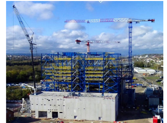
Chantier Dombasle Énergie - Chaufferie CSR en partenariat avec Véolia

Le site de Solvay Dombasle abrite également un centre de recherches et d'innovation qui travaille pour l'ensemble du groupe à travers le monde. C'est dans ce centre qu'une innovation technologique majeure a été mise au point : le nouveau procédé Solvay pour la fabrication du Carbonate et du Bicarbonate de soude, baptisé : e-solvay.