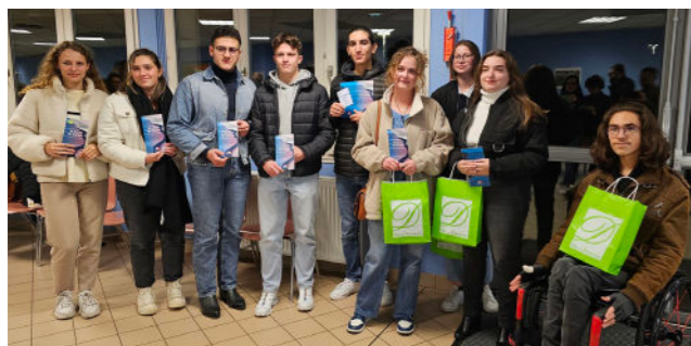
Nouveaux majeurs de la commune

Les jeunes Dombaslois avaient reçu une invitation officielle du maire et du conseil municipal à venir retirer leur carte d'électeur à l'annexe Léomont. Une dizaine d'entre eux a pris part à ce moment convivial.