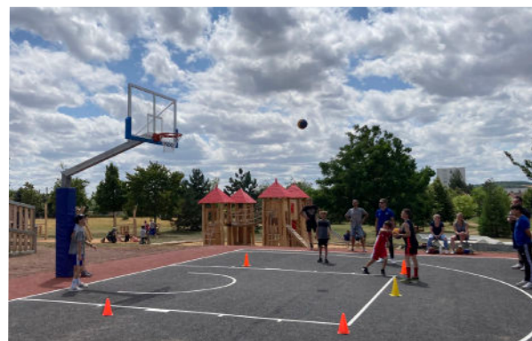
Juillet - Inauguration du jardin des poètes