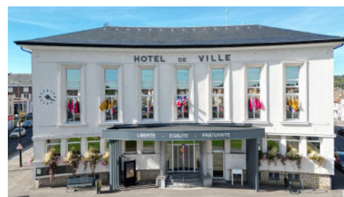
La ville habillée aux couleurs de septembre en or et octobre rose